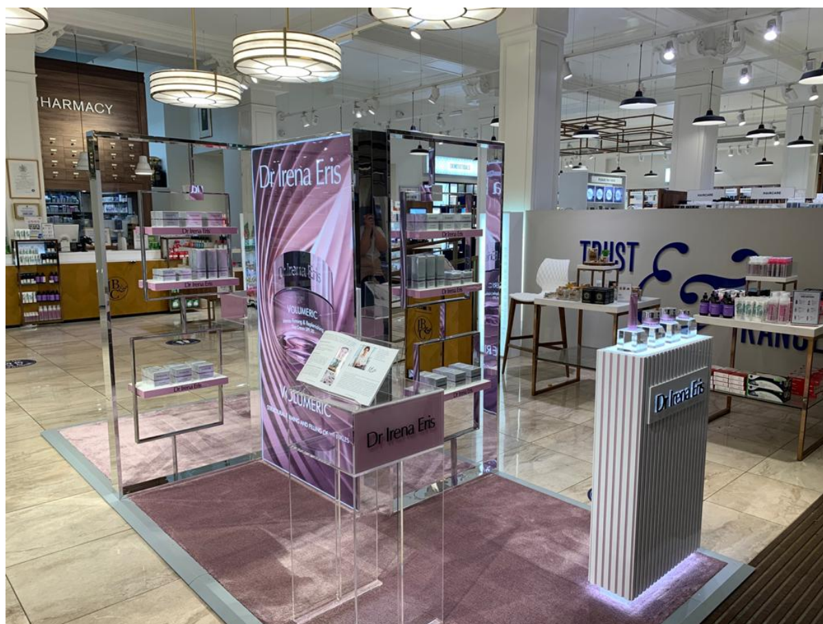
Ekspozycja w londyńskim John Bell and Croyden

Od kilku lat Dr Irena Eris współpracuje z siecią Douglas. Po Rumunii, Węgrzech, Chorwacji obecnie przyszedł czas na kluczowe rynki europejskie takie jak Niemcy, Francja czy Włochy. Istotnym dla rozwoju marki okazał się również launch w słynnym domu towarowym Rinascente w Mediolanie, który jest uznawany za jeden z najbardziej prestiżowych domów towarowych na świecie.